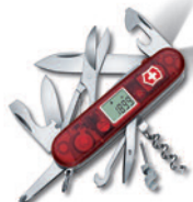
CyberTool Lite 1.7925.T