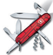
Traveller Lite 1.7905.AVT

other Lite versions Spartan Lite 1.7804.T